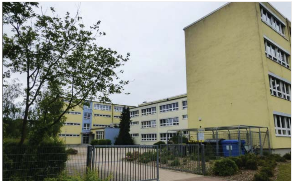
Fontane-Oberschule wird Schulzentrum

Ebenfalls mit großer Mehrheit beschlossen wurden Bebauungspläne für einen Hortneubau an der evangelischen Schule, den Ausbau der Bahnhofstraße in Karwe und den Neubau eines Autohofes in der Nähe von Dabergotz.