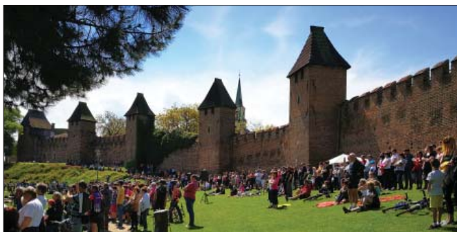
An der Stadtmauer von Nymburk