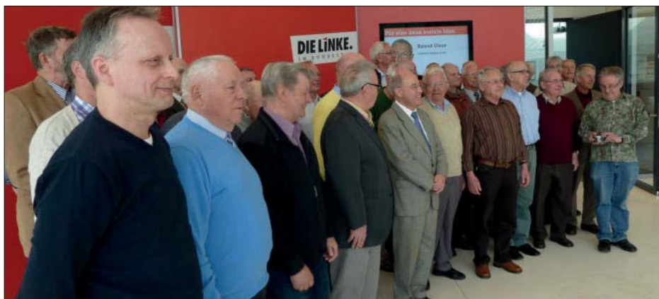
Chor mit Gregor Gysi

(Aufgeschrieben nach Informationen von Chormitgliedern)