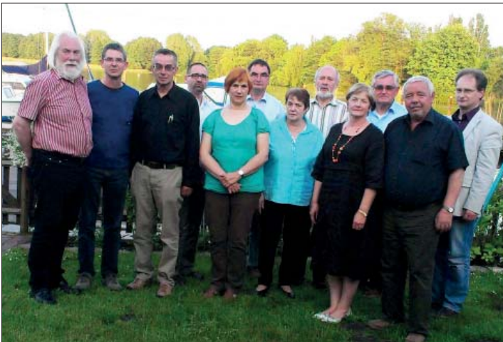
Kreistagsfraktion DIE LINKE (2008-2014)