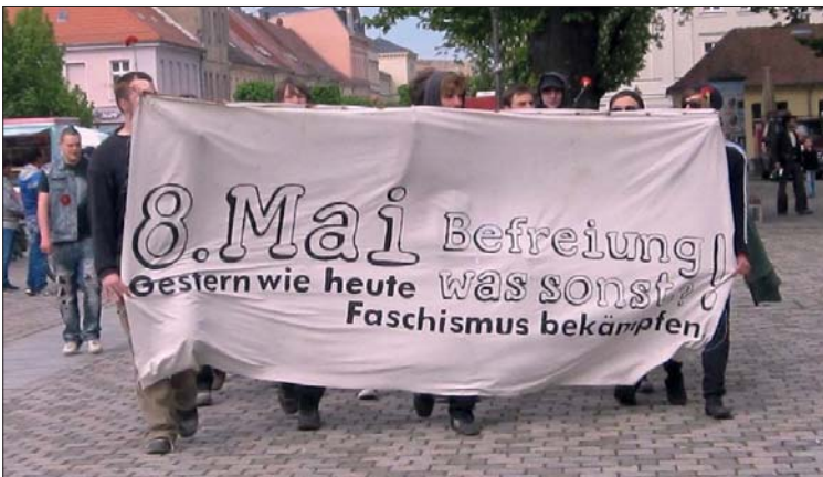
Jugendliche und Handwerksgesellen unterwegs zum OdF-Platz in Neuruppin

Traditionsgemäß versammeln sich Bürger am 8. Mai an Gedenkstätten, um der im 2. Weltkrieg gefallenen Helden der Roten Armee zu gedenken und sie zu ehren.